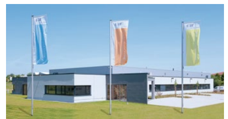
Die Druckerei Gebrüder Wilke GmbH in Hamm

Schon seit 15 Jahren arbeitet die Gebrüder Wilke GmbH mit einer DRAABE Luftbefeuchtungsanlage am Standort Grevenbroich. Auch in der neuen Produktionshalle in Hamm sollte Luftbefeuchtung als Produktionsfaktor natürlich berücksichtigt werden.